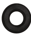
3.201.00 Kleberosette in Schwarzstahl-Optik